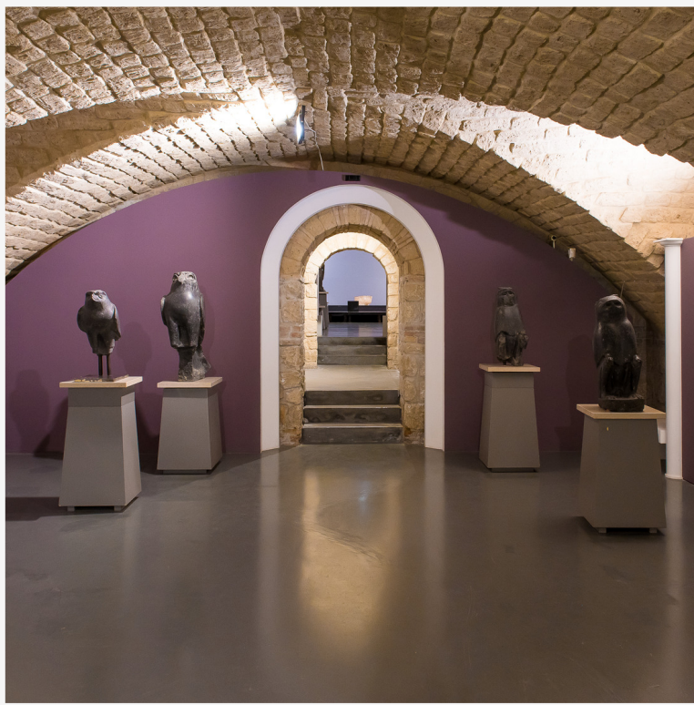
Particolare Gufi Egizi Museo Arcos- Benevento - (Foto di M. Salierno)