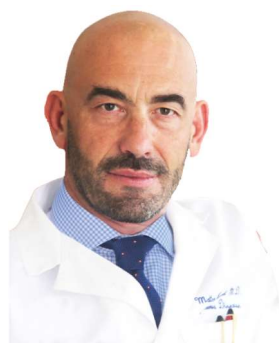
PROF. MATTEO BASSETTI DIRETTORE CLINICA MALATTIE INFETTIVE POLICLINICO SAN MARTINO DI GENOVA PROFESSORE ORDINARIO UNIGE PRESIDENTE SITA