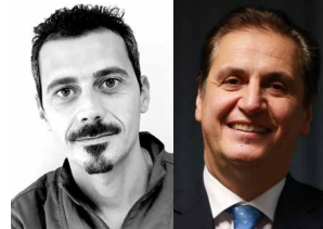
Tavola Clinica Teorico Pratica

Another reason to define the Mtwo as minimally invasive? Because their excellent cutting capacity it to be used at low speeds, saving dentin and achieving absolute precision.