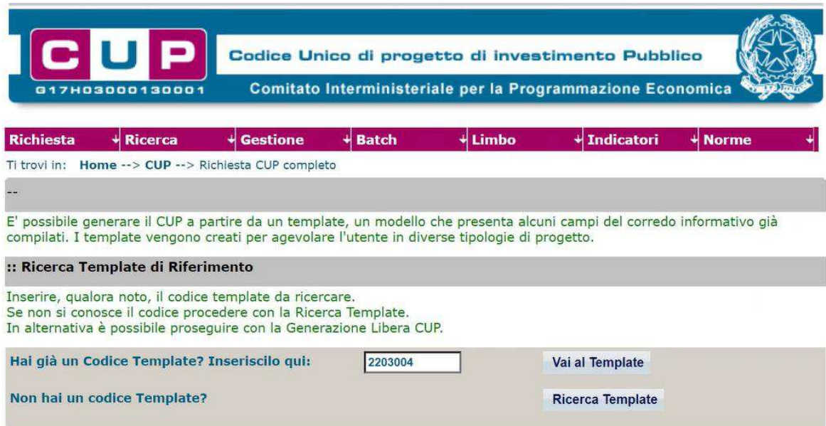
Fig. 1 – Inserimento del Codice Template