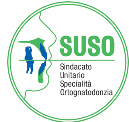
SUSO Sindacato Unitario Specialità Ortoognatodonzia