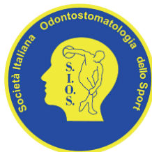
Società Italiana Odontostomatologia dello Sport S.I.O.S.