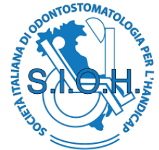
SOCIETÀ ITALIANA DI ODONTOSTOMATOLOGIA PER L'HANDICAP S.I.O.H.