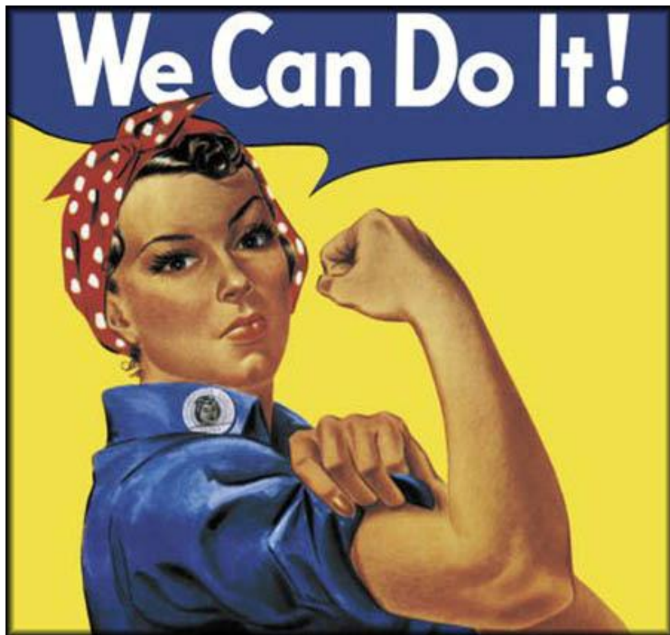
Ⓜ Rosie the riveter+